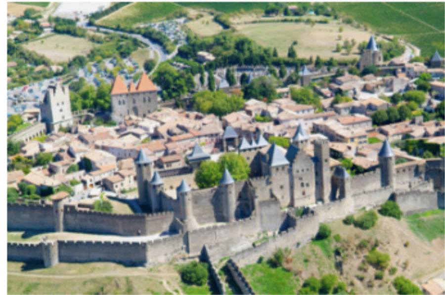
Vues aériennes de la cité de Carcassonne

Lis l'ensemble des documents, observe les photographies aériennes et complète ce texte descriptif d'une ville au Moyen-Age avec les mots suivants : beffroi - rempart - protéger - maisons - créneaux - meurtrières