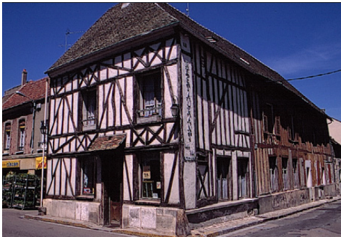
Maison à colombages à Houdan (Yvelines)