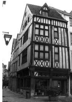
Maison à colombages