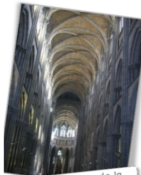
L'intérieur de la cathédrale