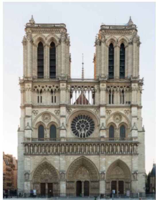
Notre Dame de Paris

→ Vous pouvez également consulter cette vidéo de 6 min qui compare les deux arts : https://www.youtube.com/watch?v=vT3Ms45jzI8