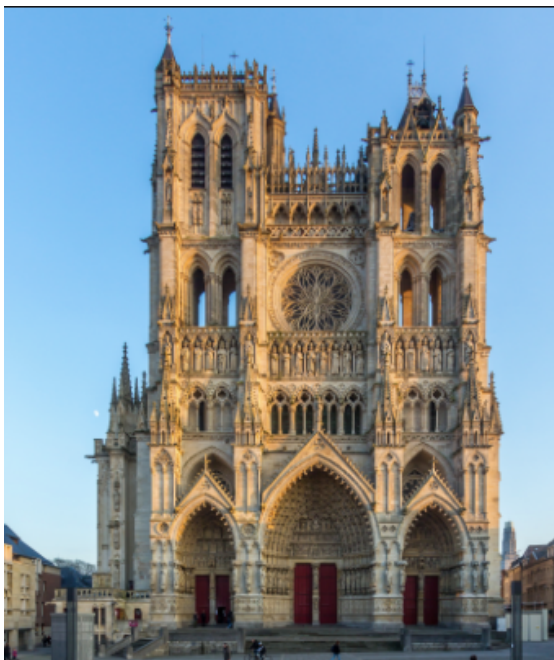
Notre Dame d'Amiens