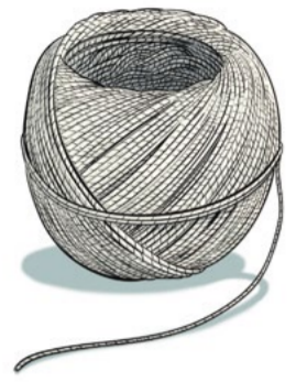
1 FICELLE sa longueur dépend de l'installation de la classe