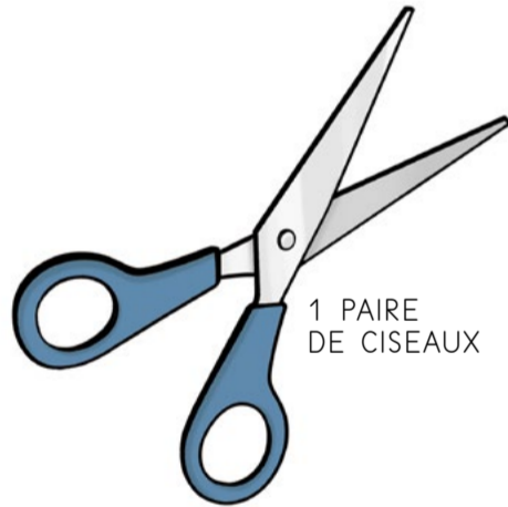
1 PAIRE DE CISEAUX