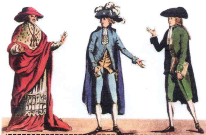
Clergé, noblesse et tiers état : les 3 ordres

Les évêques ..... et abbés ....., d'origine noble ....., pourvus de gros bénéfices, menaient, le plus souvent, l'existence des grands seigneurs. Par contre, les curés de campagne, sortis du peuple, avaient juste de quoi ne pas mourir de faim.