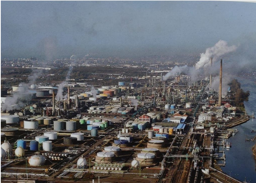
La raffinerie Total de Gonfreville-l'Orcher, près du Havre