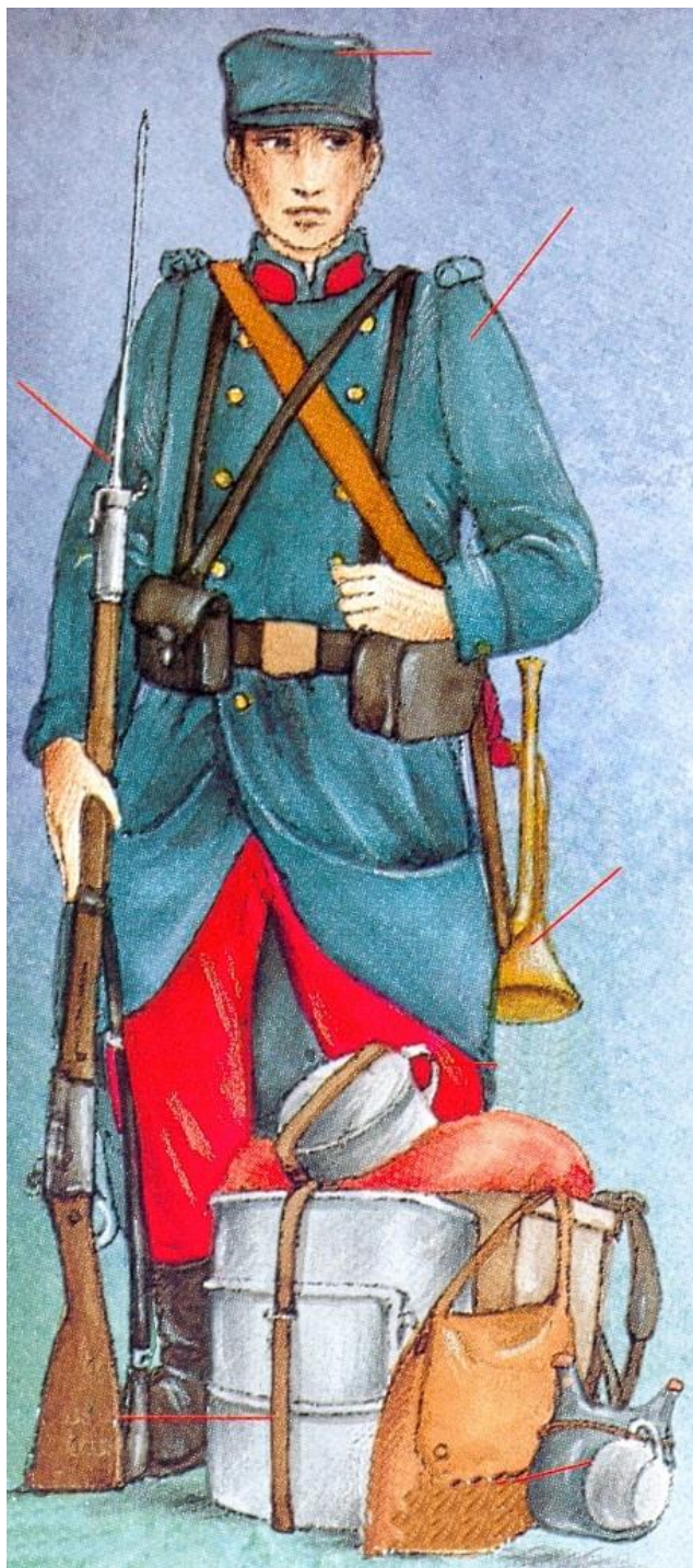
Poilu de 1914

Images Doc - Editions Bayard jeunesse - 96/97