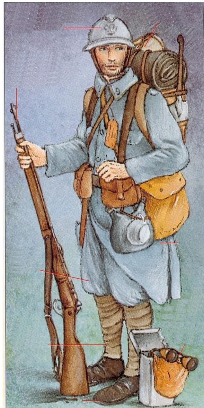
Poilu de 1915

Images Doc - Editions Bayard jeunesse - 96/97