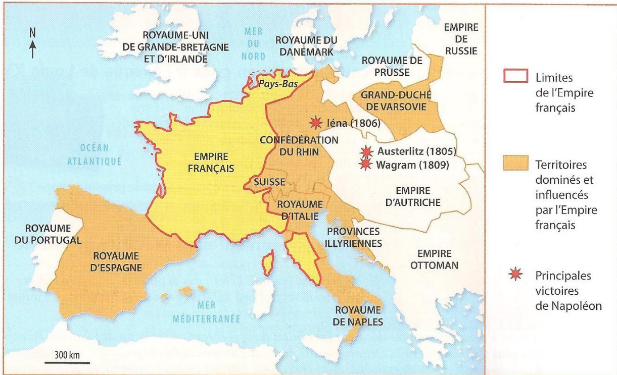
L'Europe en 1811.