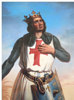
Saint Louis né en 1214

Merci pour ces précisions. J'ai une dernière question. J'ai lu dans mon guide de voyage que la sculpture de Charlemagne était présente sur la façade de l'église de Conques. Était-ce un roi du Moyen Âge?