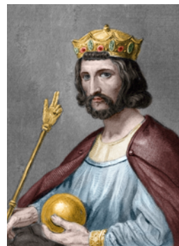
Hugues Capet né en 941

1. Qui sont ces quatre personnages? Qu'est ce qui permet de le dire ?