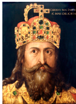
Charlemagne né en 747