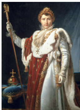
Napoléon né en 1769