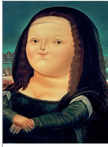
Mona Lisa à l'âge de douze ans, Fernando Botero (1959)