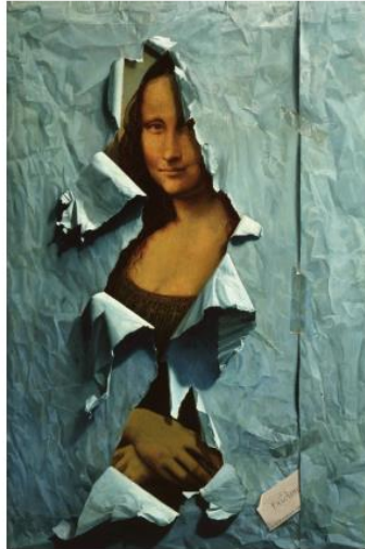
La Déchirure - Mona Lisa, Henri Cadioux (1981)