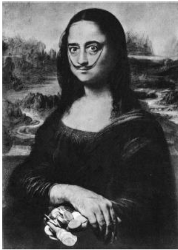
Autoportrait en Mona Lisa, Salvador Dali (1954)