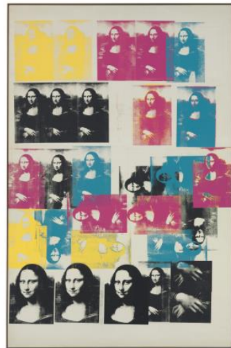
Mona Lisa, Andy Warhol (1963)