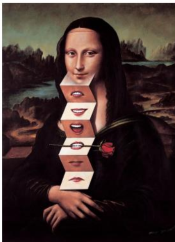
Mona Lisa, Rafał Olbinksi (2001)