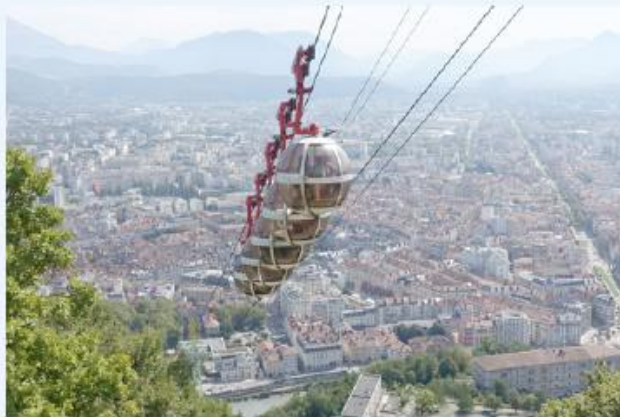
b Un téléphérique à Grenoble