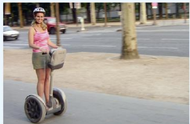
c Un Segway

Le Segway est un véhicule électrique pour une personne. Il se compose d'une plateforme encadrée par deux roues et d'un grand manche de maintien et de conduite. Le pilote s'y installe debout. Certains modèles peuvent atteindre 20 km/h et possèdent une autonomie de 40 kilomètres.