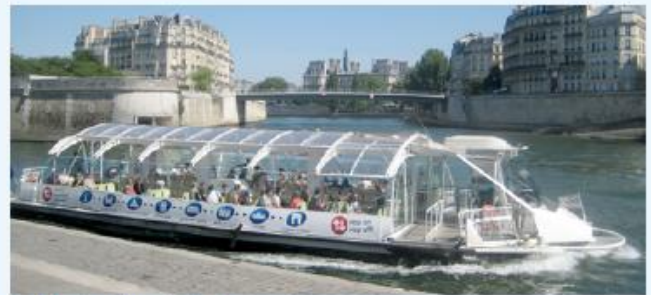
a Un batobus à Paris

Pour se déplacer dans Paris en toute liberté, Batobus a créé une ligne de circulation sur la Seine. Elle dessert 9 stations situées à proximité des grands monuments de la ville. Le billet est valide durant un jour. L'utilisateur monte et descend quand il veut, aussi souvent qu'il veut.