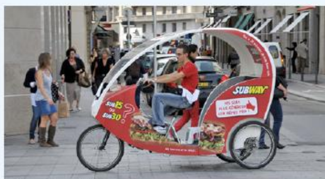
b Un cyclotaxi à Lyon

Vous les avez peut-être déjà croisés dans d'autres villes mais ils sont très présents à Lyon. Ces cyclotaxis vous conduisent où vous voulez pour 1 euro le kilomètre. Écologiques, rapides, silencieux et économiques, ils permettent de voir la ville autrement. Testez-les, c'est vraiment formidable !