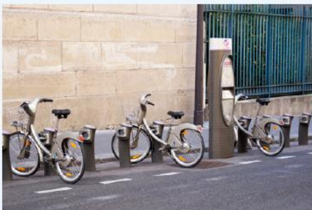
a Une station vélib à Paris

Observe ces documents et réponds aux questions.