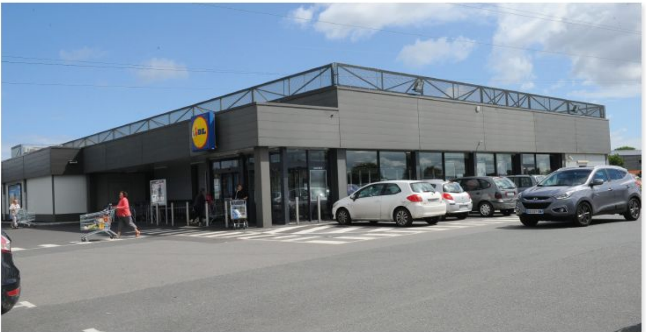
Un supermarché dans la zone de la Jannais sur la route D266.