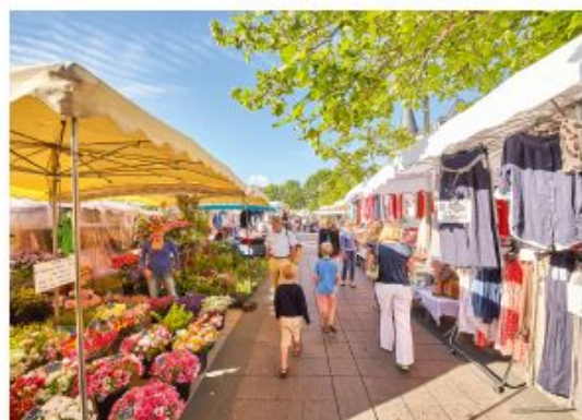
Documents 3 et 4 • Le marché de Dinard, dans les halles de la Concorde et place Crolard.

Il s'agit de quatre photos de commerces et commerçants de la ville de Dinard, une ville historique, située sur la côte, au nord de la Bretagne.