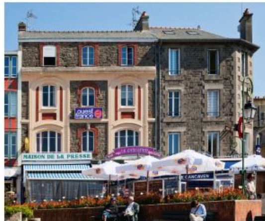
Document 2 • Place de la République, dans le centre-ville de Dinard.