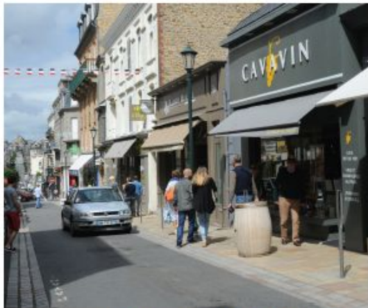
Document 1 • Rue Levasseur dans le centre-ville de Dinard, en Bretagne.