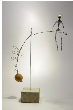
récup' arts poétiques

Ces modèles déclinent sommairement la sculpture à travers différentes époques et style.