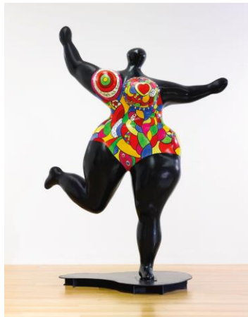
Niki de St Phalle