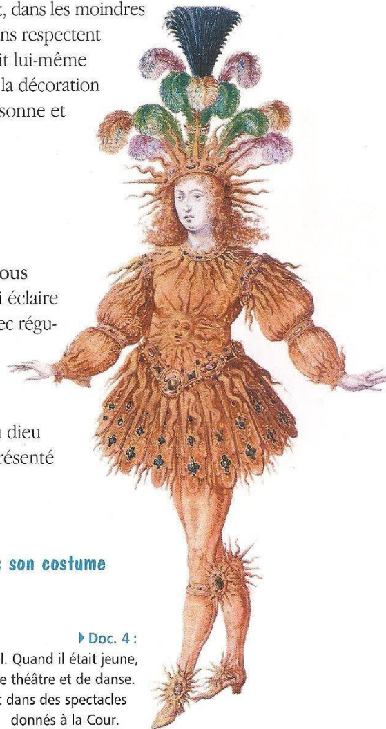
► Doc. 4 :

2 Décris le Roi-Soleil dans son costume de ballet (Doc. 4).