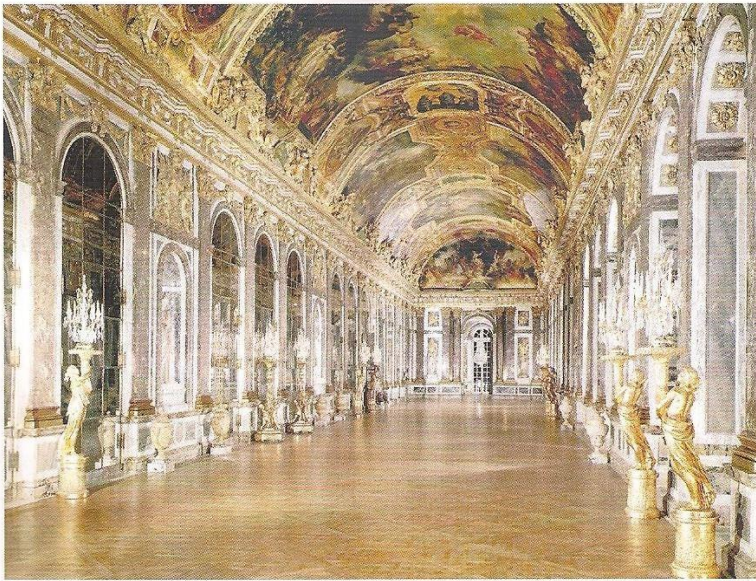
◀ Doc. 2 :

La galerie des Glaces du château de Versailles, construite en 1678.